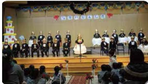
成長の喜びを知る四分の一人式