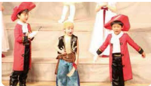
自分の感情や思いを表現するミュージカル!