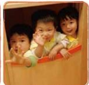
ウッドハウスはみんなの秘密基地!