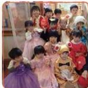
キラキラ舞台の衣装コーナーには素敵な衣装がいっぱい!