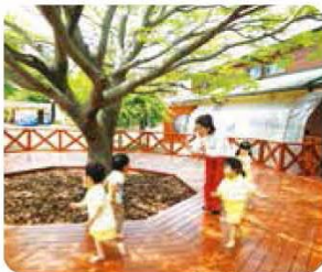
自然とのふれあい ～五感を広げる体感教育～