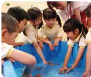
ユニ・ヒトテ、自然体験に 好奇心と想像力が芽生える！