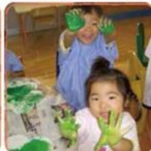
フィンガーペインティング!気持ちいい!