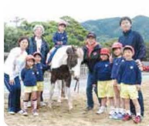
年長組/バースデイ乗馬 ～感じたことを伝える力を育てる～

また、具体的な行動指針「ゆりの樹幼稚園のめざす人間像」で、ゆりの樹と出会うすべての人が自分の人生をリラックスして、楽しんで、子育てし、めざす方向や感動する生き方、最後まであきらめない、ふれない人間力を身に付けることができる、心が育つ幼稚園です。 行事も感動的です。5歳を迎える年中組は、「四分の一人式年長組は感じたことを伝える力を養う体験、バースデイショッピング」や、バースデイ乗馬。クリスマスは、先生