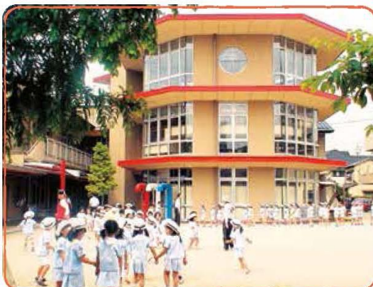
〜くつるげる空間 なぞの秘密基地〜世界のおもちゃがあつまった不思議を発見する科学のタワー