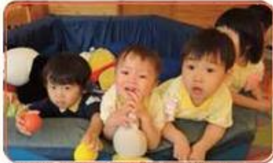
ゆりの樹ならきっと明日に向かう勇気がわいてくる!