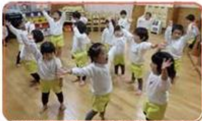
夢中で遊ぶ、見る力・聞く力が育っていく!