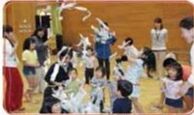
嬉しいはら衣たちができたよ!お母さんにも私たちにも!