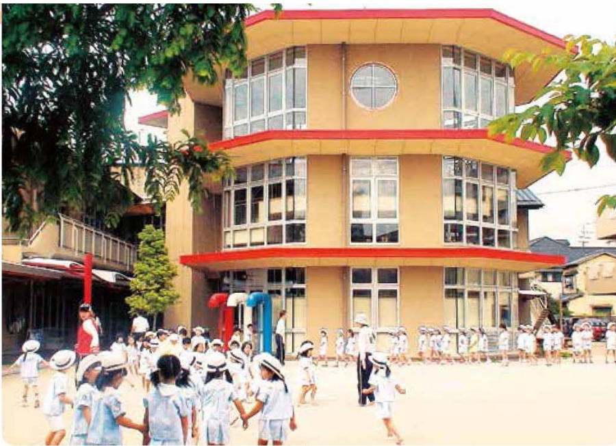
～くつろげる空間 なぞの秘密基地～世界のおもちゃがあつまった不思議を発見する科学のタワー