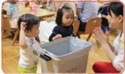
エルちゃんクラブ みて!お片付けも上手になったよ!