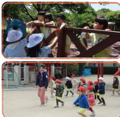
広い運動場で思いきり走れるよ!

命をまもる、不思議な大空間。自らつくる“夢時間” ゆりの樹は大きな安心がいっぱい。