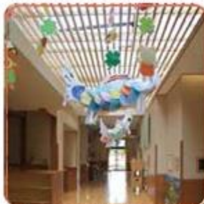
吹き抜ける風音で回るいっぴりに包まれる!