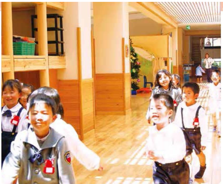
太陽の光が差し込む明るい廊下が、扉のない広々とした教室をつないでいます