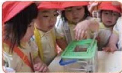
いろんなことに興味しんしん!さわって感じる力!