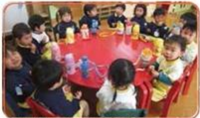
いっぱい遊んだ後はみんなでお茶タイム!