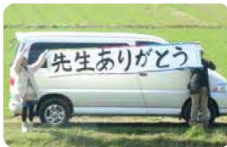
車窓から見たのは、保護者の皆さんのあたたかいメッセージ