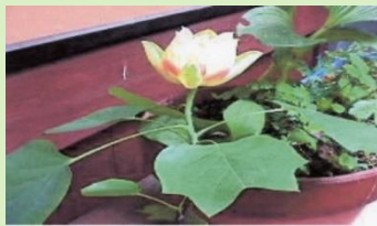
↑ 花と半纏(はんでん)形の葉