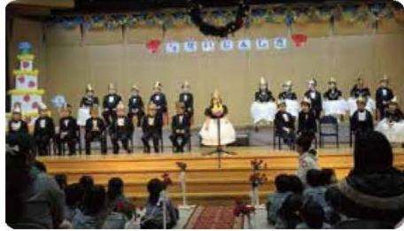
成長の喜びを知る四分の一成人式