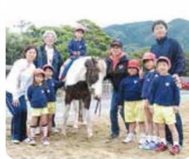
年長組バースティ乗馬 〜感じたことを伝える力を育てる〜