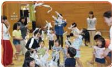
嬉しい！はら友だちができたよ！お母さんにも私たちにも！