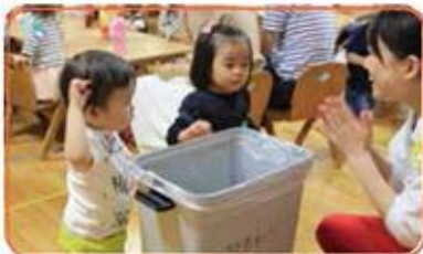
エルちゃんクラブ みて！お片付けも上手になったよ！