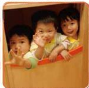
ウッドハウスはみんなの秘密基地！

から守る「ブリスマックススター」空気洗浄器、泡手指消毒、エアタオルの設置、また防犯カメラ等、園児の安全が守られています。 1. 園バスについて ① エコバスです。防災バスマップも作成し、ホームページにアップしています。 ② バスにカードコシシステム（運行状況を把握）、救急用品、水、コップ、タオル、懐中電灯、おむつ、トイレシート、パーナなどを置いてあります。 ③ バスに家電が使用できるインバーターを積んでいます。 ④ GPS 機能をつけているのでいつでも位置情報が確認できます。 2. 園内について ① 備品 - 衣箱にウォーターサーバーまたは水筒、懐中電灯、軍手など緊急用品、水、おやつ、おむつ、トイレシート、パーナ等を備蓄、幼稚園専用の充電機も設置しています。玄海ゆりの樹幼稚園にはお木、動物畑の野菜を備蓄しています。 ② 電話機能 - 職員が常備持っている園携帯に園内・園庭・外部に緊急・緊急状態を知らせるマイク機能を搭載しています。 ③ 説明書 - すべとれないLEDです。 ④ トイレ - 大人用トイレも園児達が使用できるように、大人の便座の上における園児用便座を準備しています。 ⑤ 行事 - 園児の成長を促すため、保護者の方にも年齢別や同年年の成長の違いを感じて頂くことでより感動を深めてほしいという願いから、全年度の行事を園に分けています。少ない人数での開催になる為、緊急時に混雑がしやすいこと、他の園の先生が多くなるため、警備に十分な人員があります。保護者の方の行事の手伝いも少ないです。