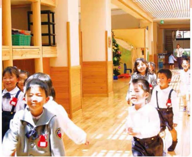
太陽の光が差し込む明るい廊下が、扉のない広々とした教室をつないでいます