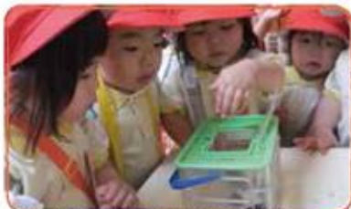
いろいろなことに興味しんしん！さわって感じる力！