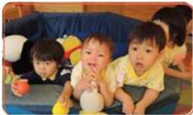
ゆりの樹ならきっと明日に向かう勇気がわいてくる！