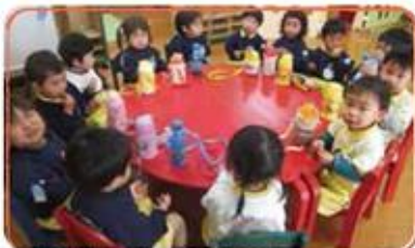
いっぱい遊んだ後はみんなでお茶タイム！