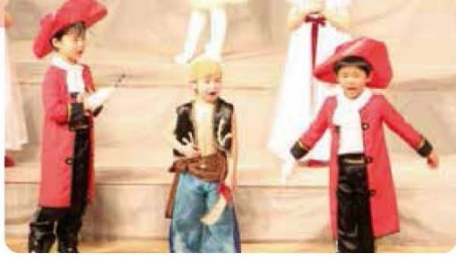
自分の感情や思いを表現するミュージカル!