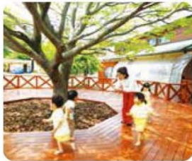
自然とのふれあい 〜5感力を広げる体感教育〜