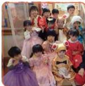
キラキラアワーの交際コーナーには素敵な衣装がたっぷり