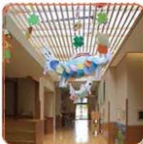
吹き抜けの裏書で回るいびだまりに包まれる！