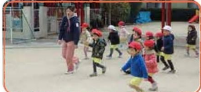
広い運動場で思いきり走れるよ!