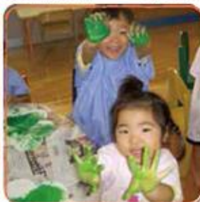
フィンガーペインティング！気持ちいい！