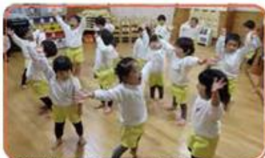
夢中で遊ぶ、見る力・聞く力が育っていく！