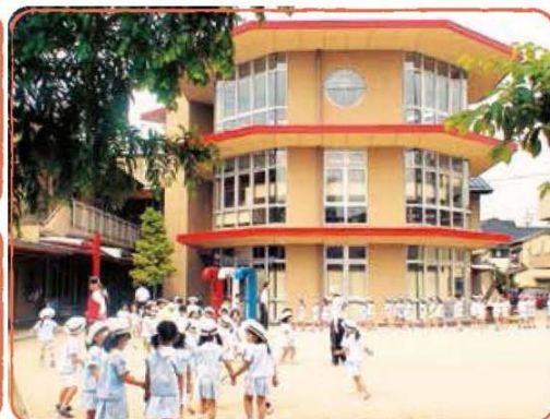
〜くつろげる空間 などの秘密基地〜世界のおもちゃがあつまつた不思議を発見する科学のタワー