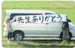
車窓から見たのは、保護者の皆さんのあたたかいメッセージ