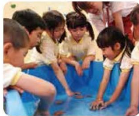
ウニ・ヒトマ、自然体験に 好奇心と想像力が芽生える!