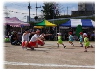
みらい組・たいじゅ組の様子